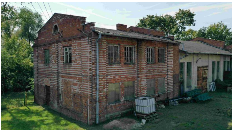
Elewacje północna i wschodnia

zał. graficzny dot. lokalizacji w skali 1:1500